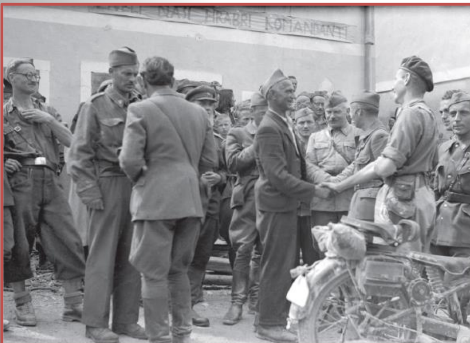
Po kapitulaciji Italije je naraščalo število partizanov.

Ob vaških stražah je na Slovenskem delovalo tudi Četniško gibanje