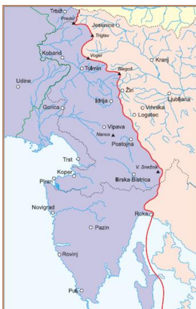
Slika 3: Zahodna meja po podpisu rapalske pogodbe

Na pariški mirovni konferenci je Italija zahtevala ozemlje, ki je pripadlo po podpisu londonskega sporazuma. Z vojsko so kasneje zasedli še večje ozemlje. Pri Vrhnikih so jih uspeli zaustaviti srbski vojaki.