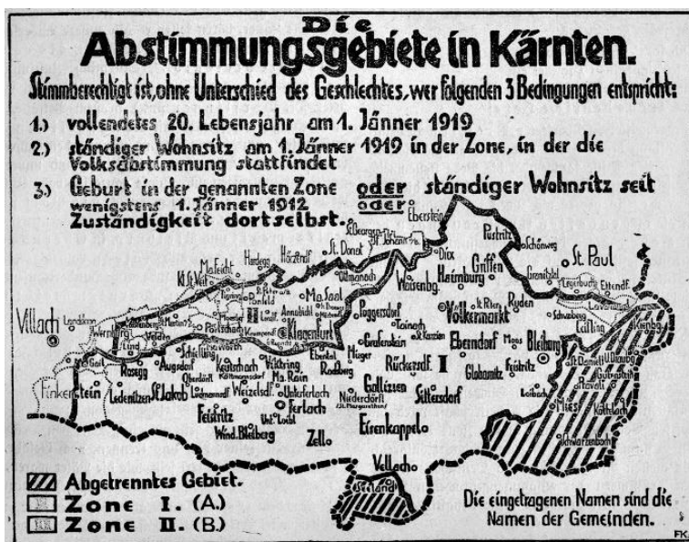
Slika 2: Koroški plebiscit (Cona A in Cona B)

Maister je s podporniki želel osvojiti tudi Koroško, a mu zaradi utrujenosti vojakov in prepozne pomoči iz Beograda to ni uspelo. Vprašanje meje na Koroškem so rešili na pariški mirovni konferenci. Velesile so imele različne ideje o rešitvi vprašanja. Najbolj pomembna je bila ameriška komisija, ki je ugotovila, da je ozemlje zemljepisno in narodnostno nedeljivo in je zato zagovarjala mejo na Karavankah. Mirovna