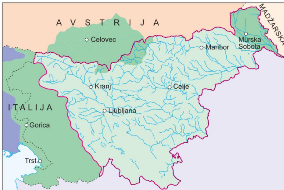
Slika 1: Prikaz spornih mejnih ozemelj

O slovenskih mejah se je odločalo med prvo svetovno vojno z londonskim sporazumom (1915 - Italija), po vojni pa na pariški mirovni konferenci in z mirovnimi pogodbami. Na spodnjem zemljevidu so s temno zeleno prikazana območja, kjer so živeli Slovenci in meja po prvi svetovni vojni ni bila določena.