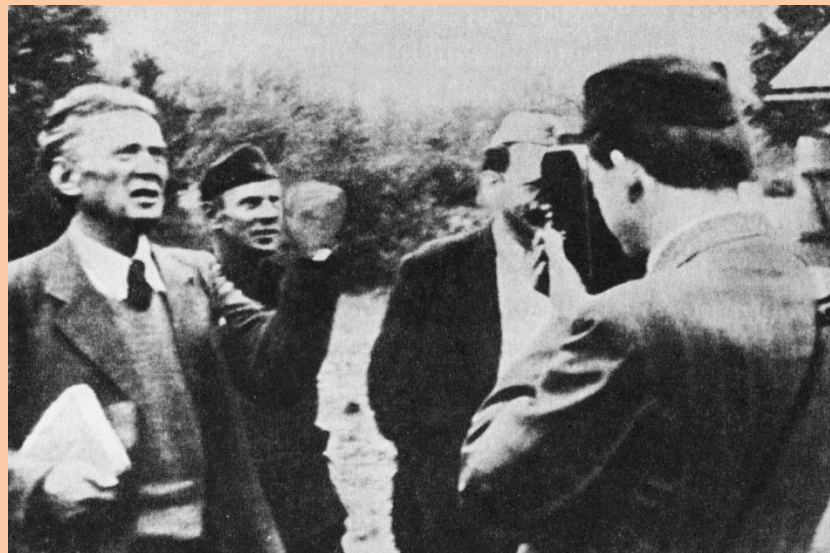
Dr. Ivan Ribar, predsednik Avnoj-a.