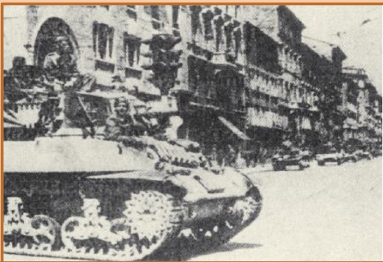
Enote Jugoslovanske armade ob osvoboditvi Trsta.

(Titov govor ob osvoboditvi Beograda, 1944)